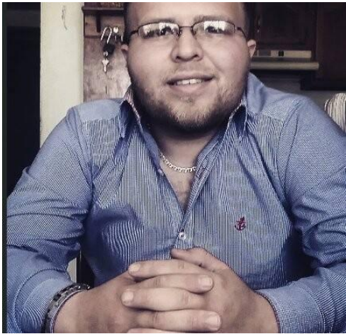
RAUL ENRIQUE MORALES MILLANES

DIRECTOR DEL INSTITUTO DE LA JUVENTUD CANANENSE